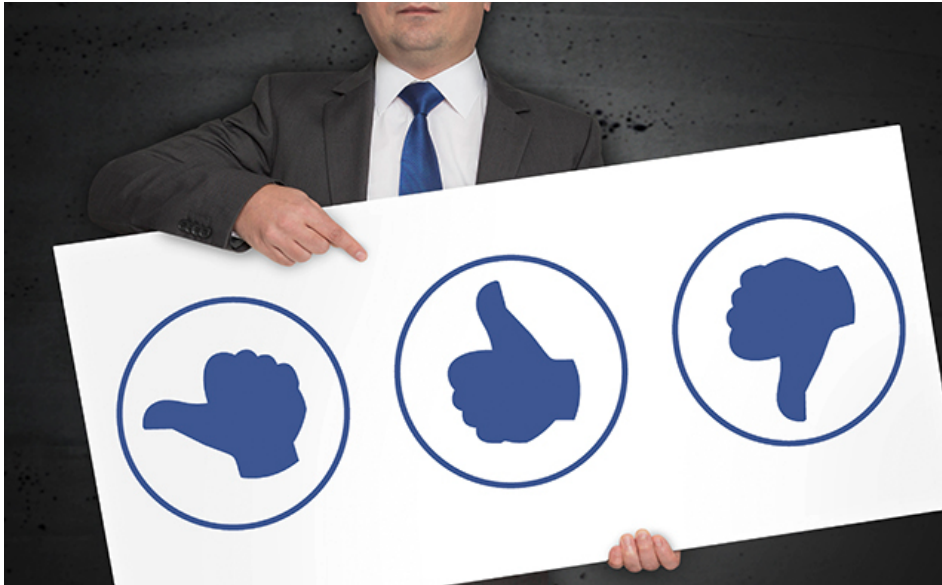
Besser, aber noch nicht perfekt: Auch der neue Entwurf des Hinweisgeberschutzgesetzes bietet noch einige Kritikpunkte.