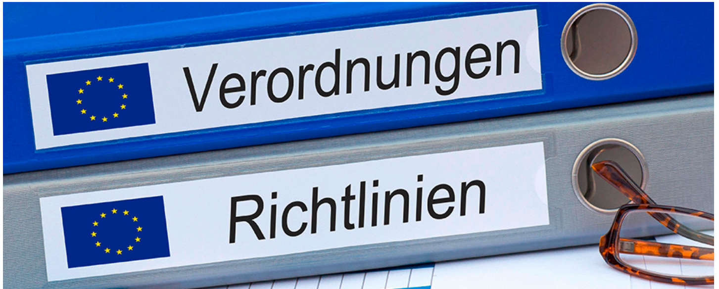
EU-Produktsicherheitsvorgaben sorgen für immer strenger definierte Marktregularien.

Als wenn es aus dem Blickwinkel der Industrie nicht schon genug wäre, die Regelungen zur Produkt-Compliance werden nochmals in den nächsten zwei bis drei Jahren deutlich an Fahrt aufnehmen. Das mag primär den Verbraucherschutz erfreuen, gängelt aber die Unternehmen, führt zu weiter verschärften produktsicherheits-technischen Maßnahmen und heizt die Kostenspirale aufs Neue an.