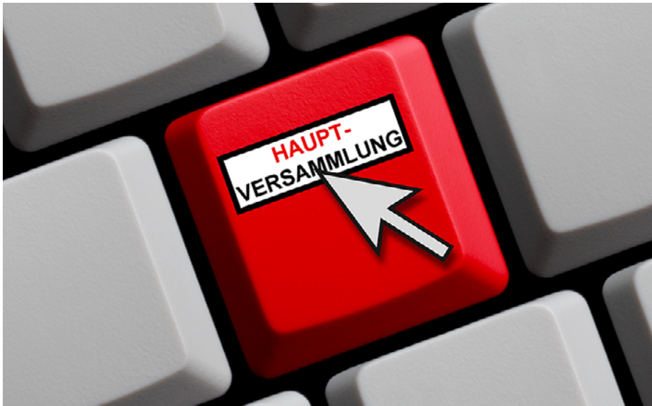
Hauptversammlung am PC: Das soll nach den positiven Erfahrungen während der Pandemie nun dauerhaft möglich sein.

Das Bundeskabinett hat am 27. April 2022 den Entwurf eines Gesetzes zur Einführung virtueller Hauptversammlungen von Aktiengesellschaften beschlossen. Die Corona-Pandemie war Auslöser, die Möglichkeit zu schaffen, Hauptversammlungen ausschließlich im virtuellen Format abzuhalten. Die „grundsätzlich positiven Erfahrungen und die fortschreitende Digitalisierung des Aktienrechts“ seien nun der Grund für eine dauerhafte Regelung“, heißt es in einer Mitteilung des Bundesjustizministeriums. Doch es gibt auch Kritik daran.