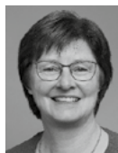
Rosi Steinberger, MdL